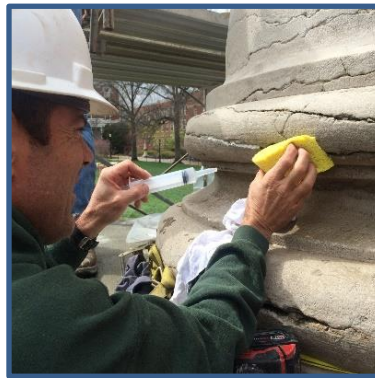
Traitement de pierres par injection de chaux, The Columns (Université du Missouri, Columbia, MO), Stephen Hills, 1840, Source: Chris Gembinski

Le comité a parrainé un atelier de deux jours à la conférence de l'APT de 2019 à Miami. L'atelier incluait un volet théorique ainsi qu'un volet pratique d'évaluation de pierres calcaires et de terrazzo faisant ainsi la démonstration de différentes approches d'essai pour des projets de conservation.