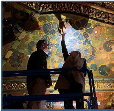
Conservation de finis dorés et au pochoir, théâtre El Capitan, Los Angeles, CA, Morgan, Walls & Clements, 1926

Fondé en 2016, le Comité technique pour les matériaux (TCM) est un carrefour d'échange d'information sur les matériaux et assemblages architecturaux de constructions historiques, ainsi que sur les matériaux pour la réparation de bâtiments.