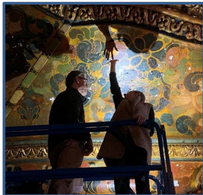
Conservazione delle finiture dorate e stampate, El Capitan Theatre, Los Angeles, CA, Morgan, Walls & Clements, 1926, Crediti: Kat Gardner

Il Comitato Tecnico per i Materiali è stato creato nel 2016 per fungere da punto di riferimento per la raccolta di informazioni su materiali e insiemi architettonici di costruzioni storiche e, altresì, sui materiali per il recupero degli edifici.