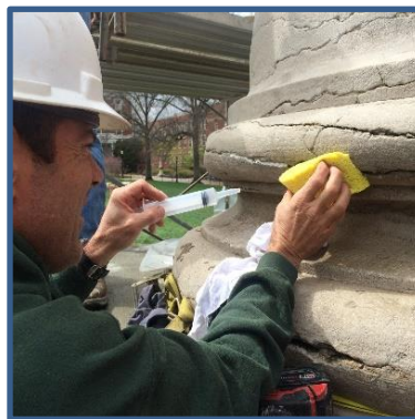
Trattamento della pietra mediante iniezioni a base di calce di The Columns (Missouri University, Columbia, MO), Stephen Hills, 1840

Il comitato ha promosso un workshop di più giorni in occasione della Conferenza APT 2019 di Miami. Tra i contenuti del workshop sono stati affrontati aspetti tecnici e metodi di valutazione in situ di elementi in pietra calcarea e superfici rivestite a terrazzo per dimostrare diversi approcci nell'esecuzione di analisi propedeutiche a progetti di conservazione.