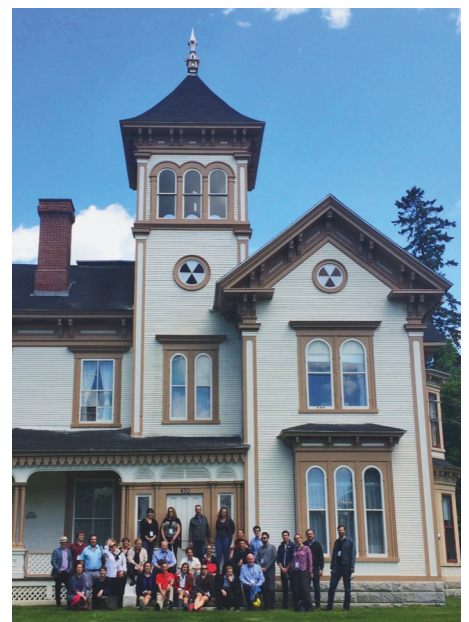
Workshop sul granito appalachiano nella Butters House a Stanstead, Quebec, 2018