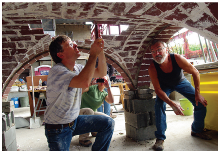
Costruzione di casseforti presso l'Officina della Volta catalana, Congresso annuale APT, 2013, New York