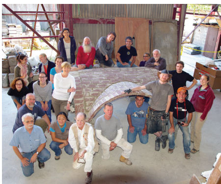
Partecipanti al seminario pratico per la costruzione della Volta catalana

del Patrimonio architettonico in Nord America. Originariamente creato come progetto congiunto di esperti del restauro in Canada e negli Stati Uniti, APT ha oggi circa 1.500 membri in oltre 30 paesi, tra cui conservatori dei Beni Culturali, architetti, ingegneri, restauratori, consulenti, costruttori, artigiani, curatori di musei, sviluppatori di tecnologie, professori, storici, paesaggisti, ricercatori e tecnici.