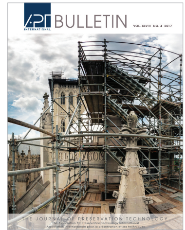
Bollettino di APT: La Rivista della Tecnologia per la Conservazione

APT ha inoltre ideato e realizzato la Building Technology Heritage Library (BTHL), una biblioteca digitale di pubblicazioni fuori catalogo relative alla storia dell'architettura e delle tecnologie di costruzione. Comprende cataloghi commerciali e altre pubblicazioni ottenute da varie istituzioni pubbliche e private. Viene regolarmente aggiornata con nuovi documenti, ed è completamente a disposizione del pubblico e dei professionisti, costituendo, in questo modo, una fonte inesauribile di informazioni per architetti, conservatori e gestori del patrimonio.